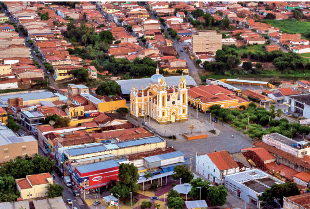
Vista aérea da Basílica Menor de São Francisco das Chagas e de parte da cidade de Canindé, Ceará