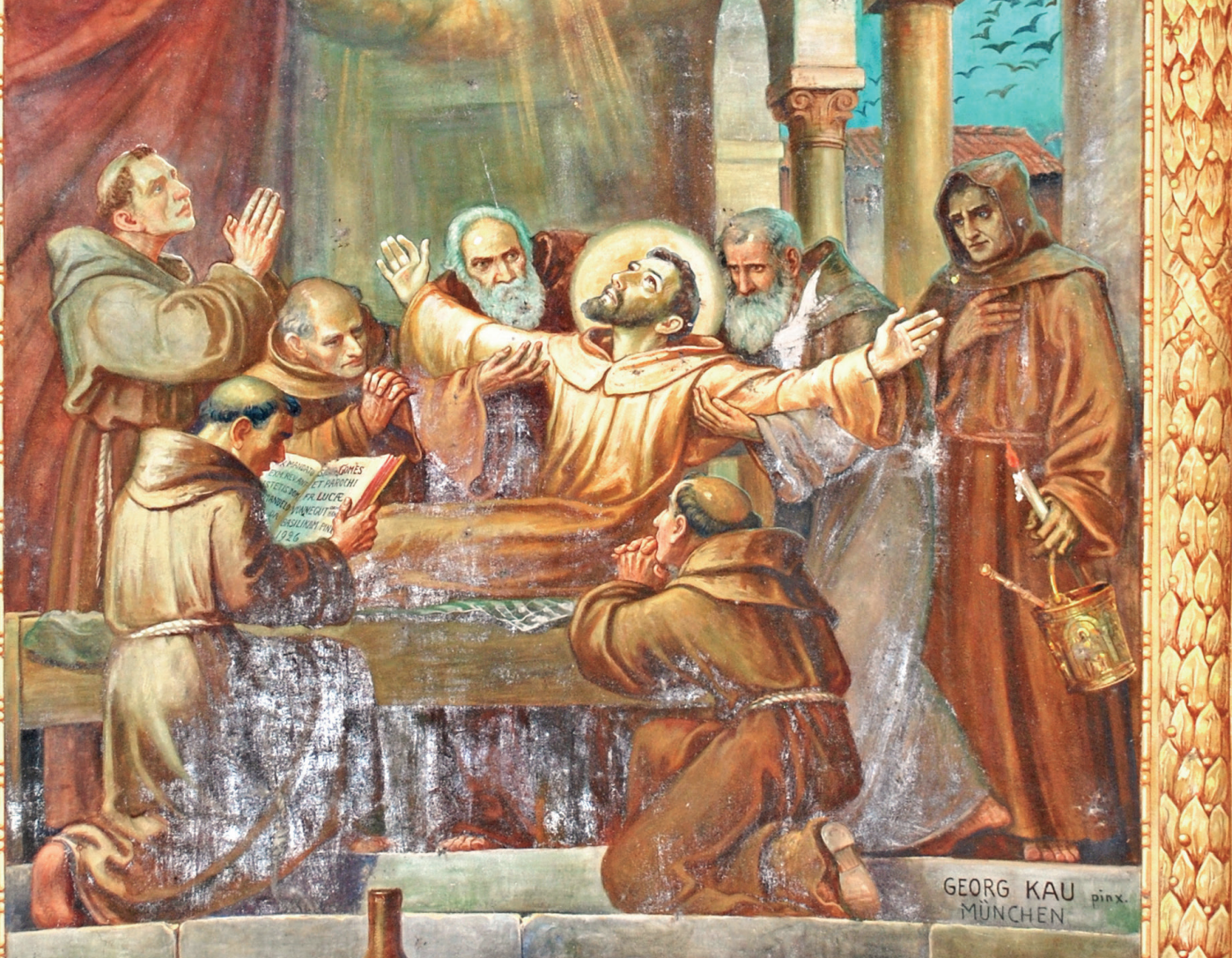
Afresco pintado pelo artista Georg Kau na Basílica retrata a morte de São Francisco