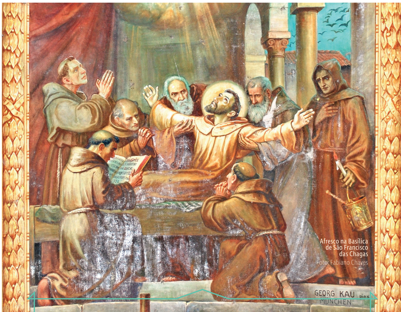
Afresco na Basílica de São Francisco das Chagas