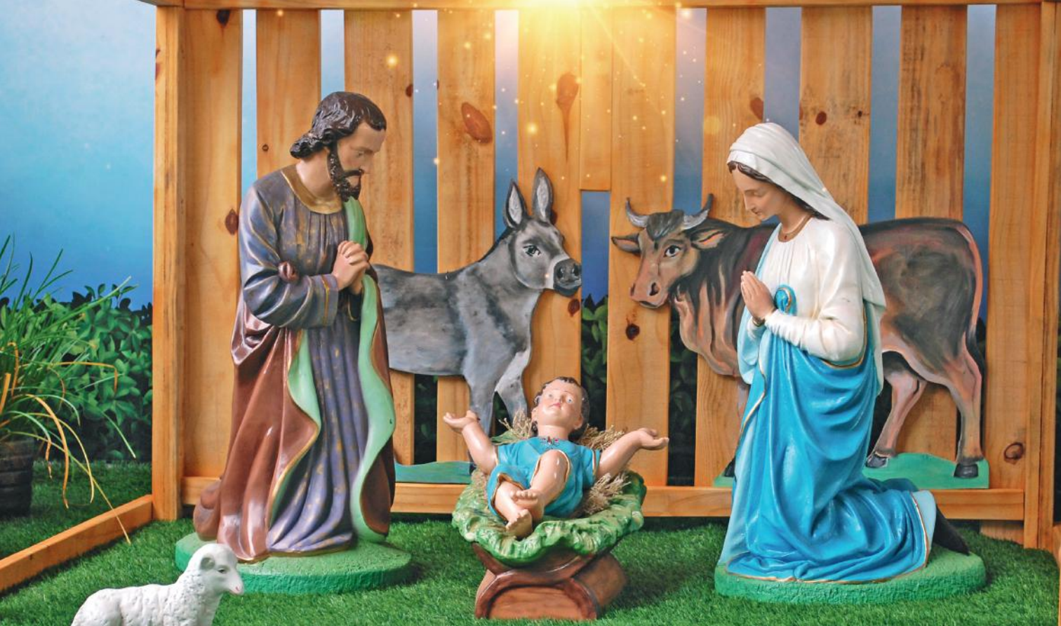
Presépio de Natal montado no Santuário de São Francisco das Chagas, em Canindé