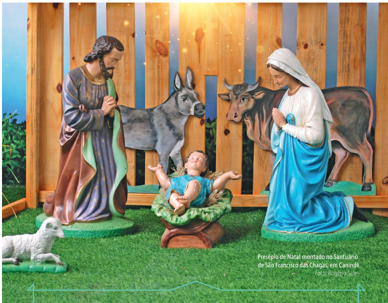
Presépio de Natal montado no Santuário de São Francisco das Chagas, em Canindé

Com São Francisco louvamos o Menino Deus, sinal de Esperança