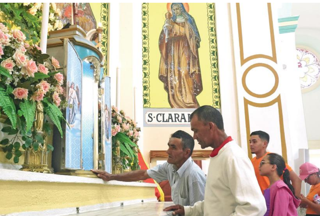
Romeiros e peregrinos manifestam fé e gratidão no altar da Basílica de São Francisco das Chagas, em Canindé, durante o Ano Jubilar da Esperança 2025