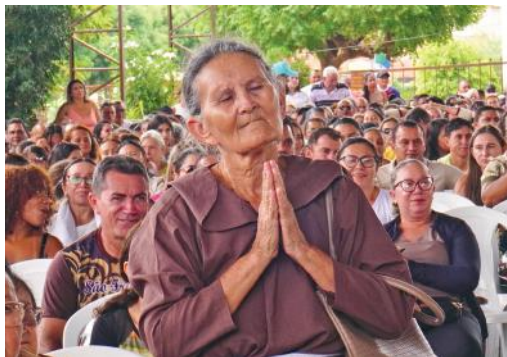
Com fé e devoção, fiéis participam da Romaria de Natal no Santuário de São Francisco das Chagas, em Canindé

Que este Natal em Canindé reacenda em cada coração a chama da fé e da esperança e nos una na certeza de que, com São Francisco, podemos louvar o Menino Deus como sinal eterno de que o amor divino nunca nos abandona. Venha celebrar conosco esta linda jornada de fé e renovação, onde cada coração se torna uma manjedoura viva para acolher o Salvador. ✕