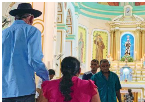
Romeiros de São Francisco celebram o espírito franciscano do Natal do Senhor no Santuário de Canindé, CE

Não perca essa oportunidade de fortalecer sua vivência de fé e comunhão com a comunidade de fé. Participe da Romaria de Natal no Santuário de Canindé e seja um Peregrino da Esperança! ✕