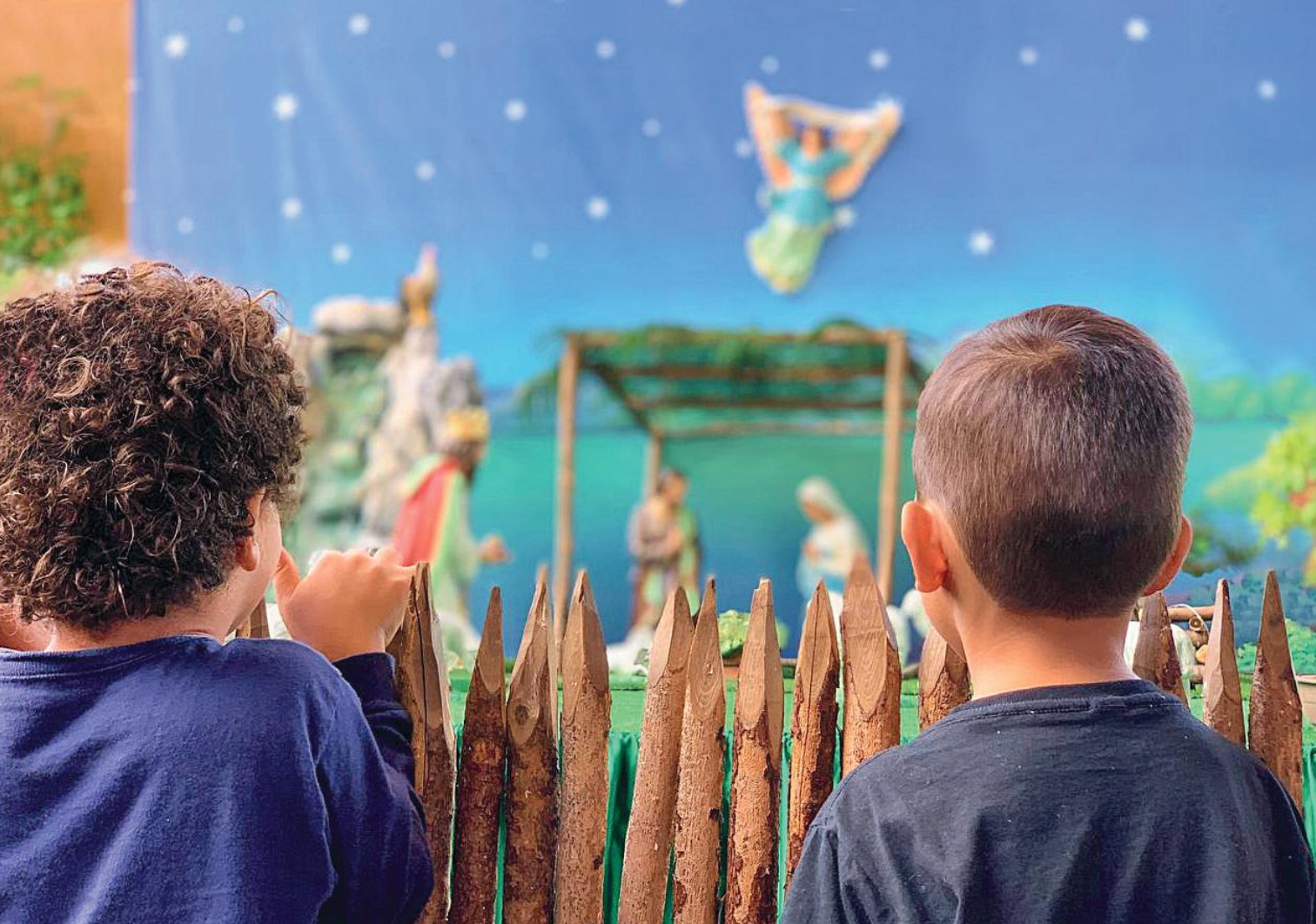
Crianças romeiras contemplam o presépio de Natal no Santuário