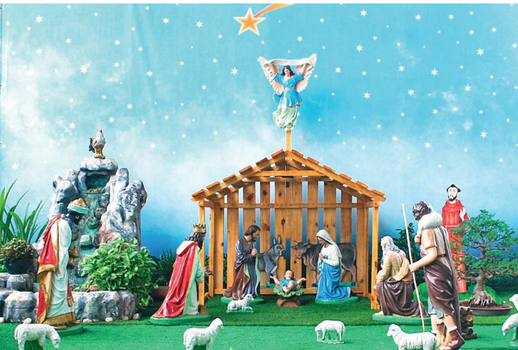
Presépio de Natal montado na Quadra da Gruta de Nossa Senhora de Lourdes, no Santuário de Canindé, CE