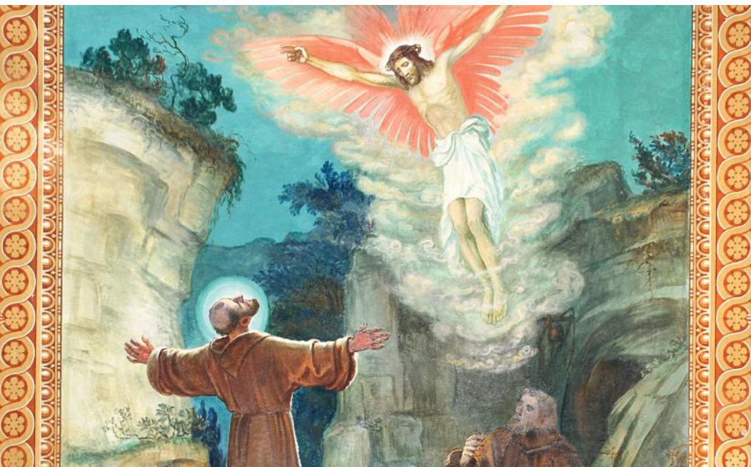
Afresco no teto da nossa Basílica apresenta as Chagas de São Francisco. A pintura feita por Georg Kau, em 1926, contribuiu para a celebração do Ano Franciscano que recordou o 7º Centenário da morte de São Francisco