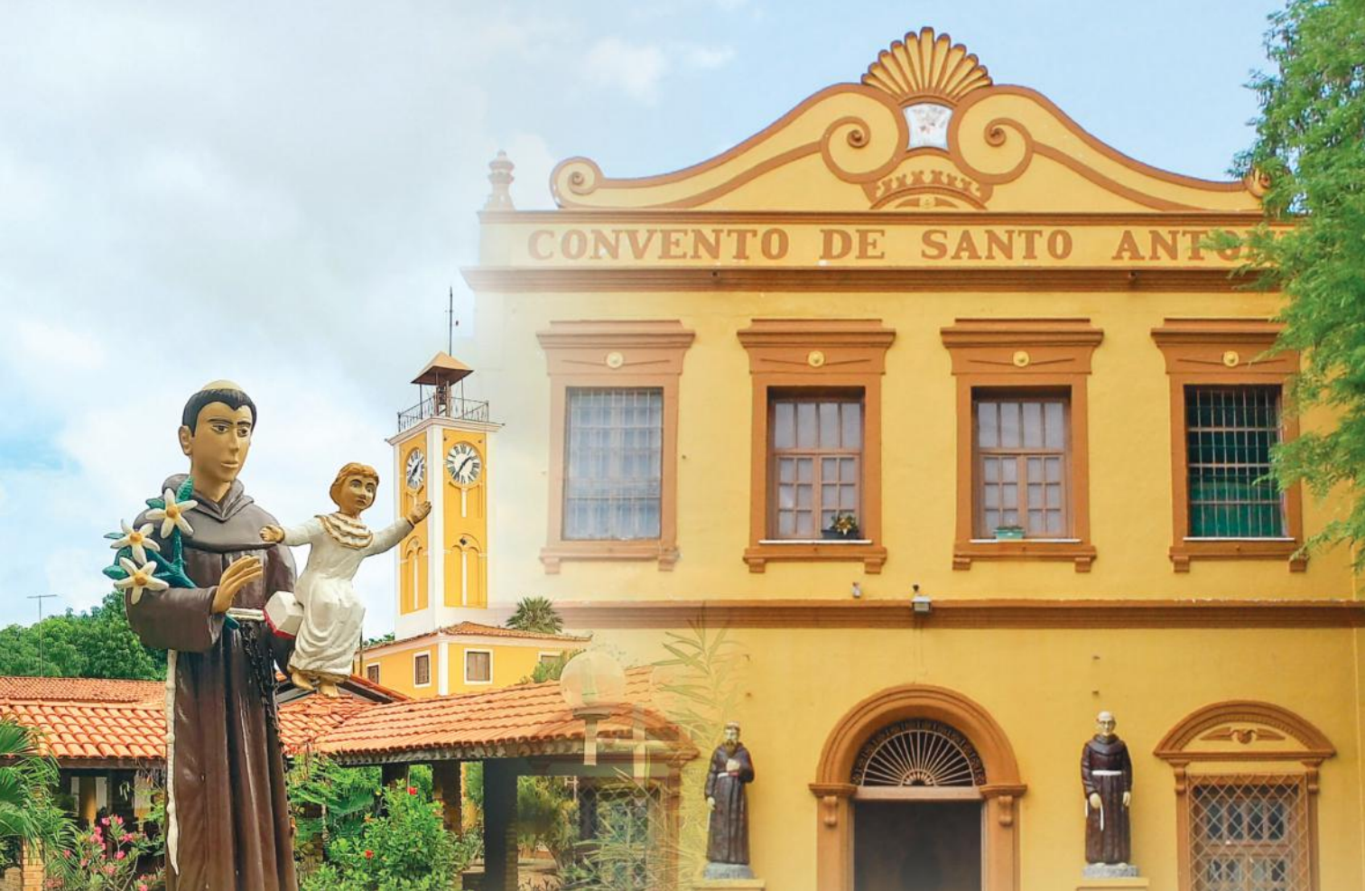
Convento Santo Antônio de Canindé, CE