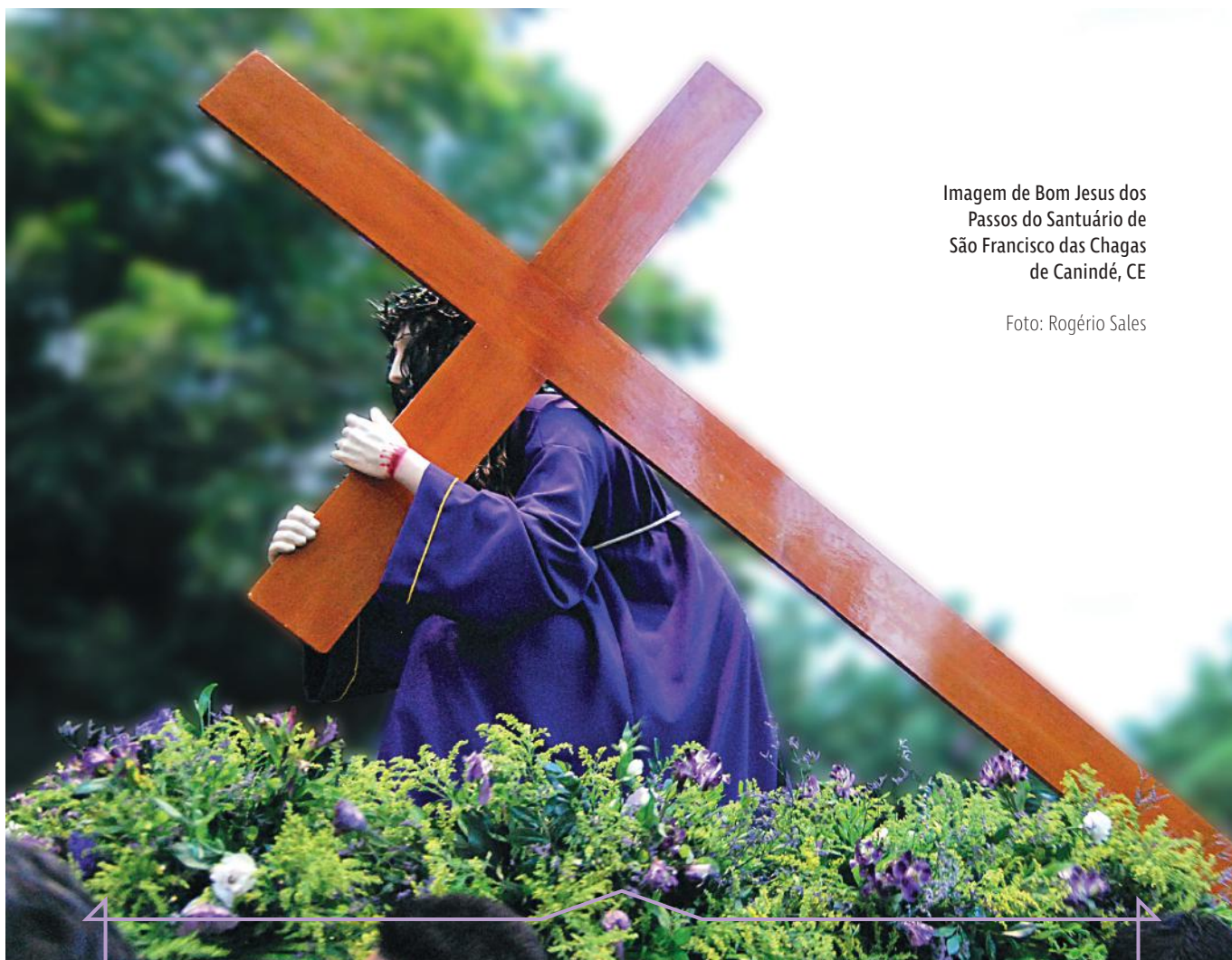
Imagem de Bom Jesus dos Passos do Santuário de São Francisco das Chagas de Canindé, CE