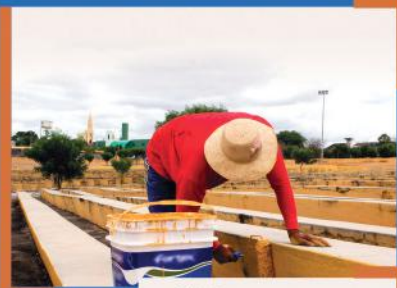
Pinturas e reparos na Praça dos Romeiros