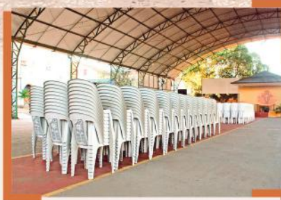
Aquisição de novas cadeiras para a Quadra da Gruta do Santuário