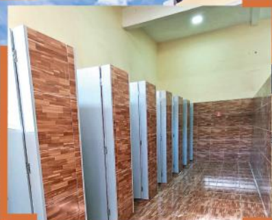
Construção de um novo bloco de sanitários masculino e feminino