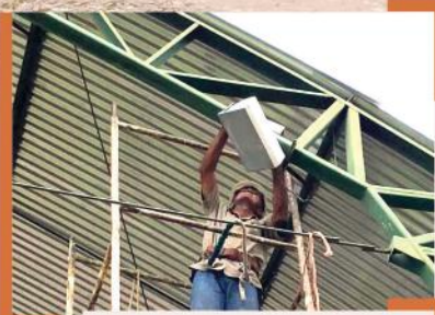
Instalação de novas luzes na Quadra da Gruta do Santuário