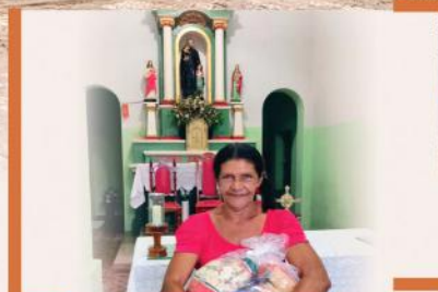
Projeto social "Tive fome e me deste de comer" com doação mensal de cestas básicas à famílias carentes