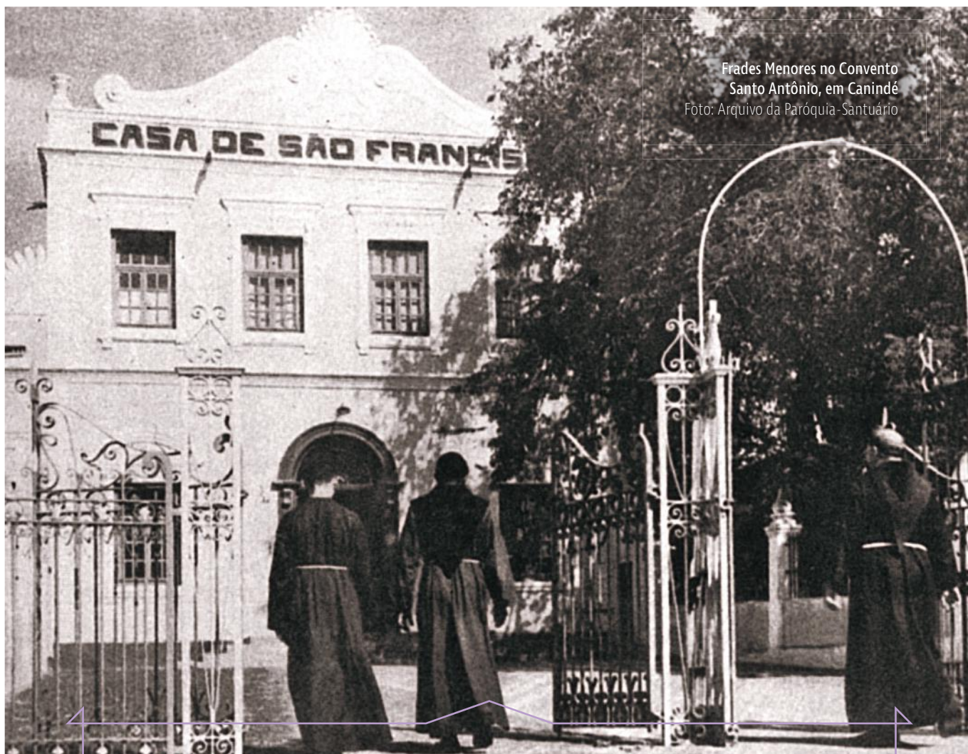
Frades Menores no Convento Santo Antônio, em Canindé

100 anos da Ordem dos Frades Menores cuidando de Canindé