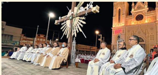
Franciscanos na celebração de abertura da Festa 2022