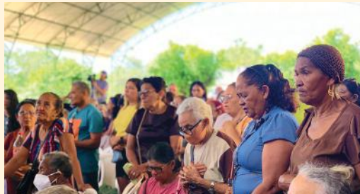
Devotos na celebração da Festa 2022