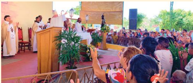
Missa de Encerramento da Festa de São Francisco