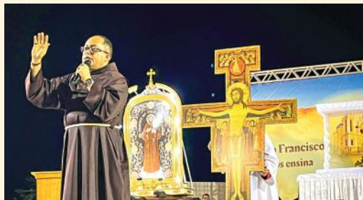
Reitor do Santuário na Novena