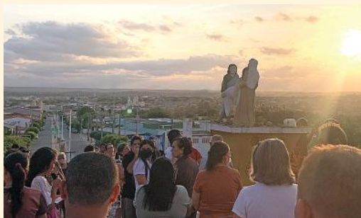
Devotos participam da Via-Sacra