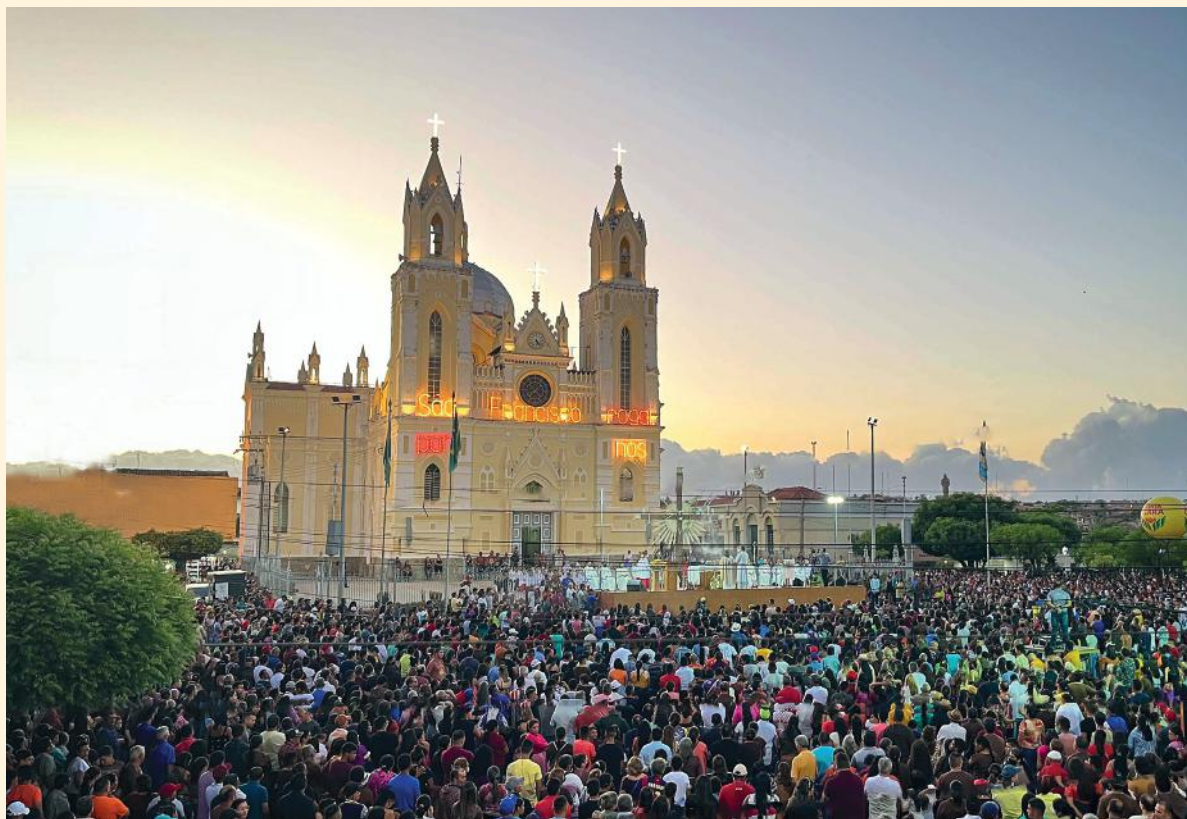
Abertura da Festa de São Francisco retorna para a frente a Basílica com a presença de milhares de devotos