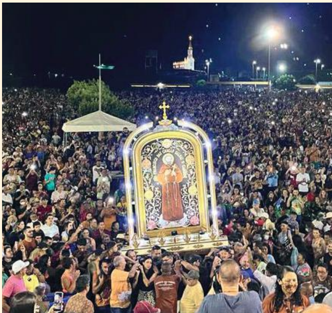
Painel de São Francisco chega para a Novena