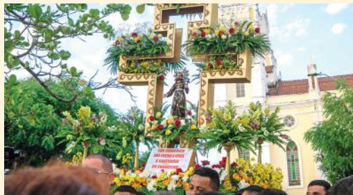
Procissão de São Francisco em Canindé