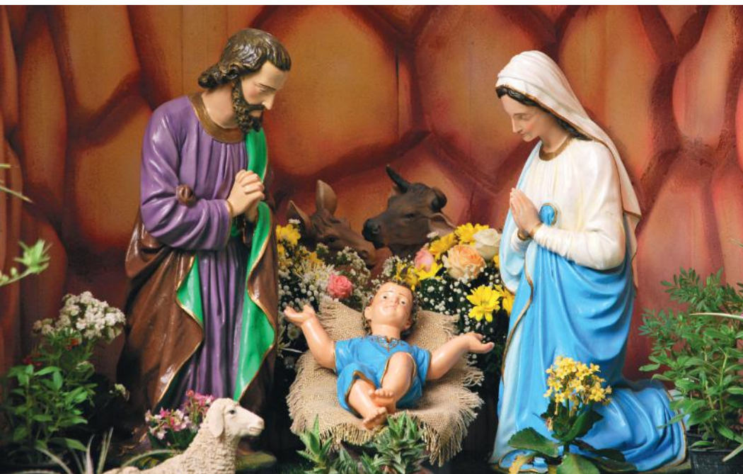
Presépio do Santuário de São Francisco das Chagas, em Canindé, CE