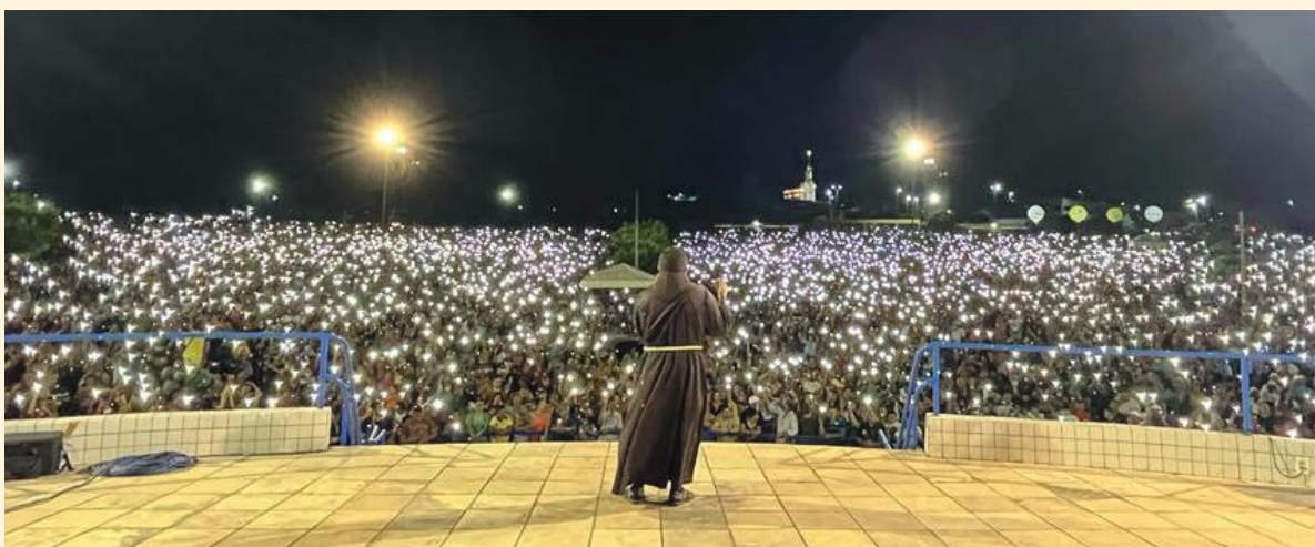
Devotos iluminam a Praça dos Romeiros nas noites da Novena de São Francisco das Chagas, em Canindé